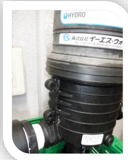
・ボディから漏水

弊社 業務部ではこれらの製品をより長くお使い頂けるように、修理・保守を行なっております。修理依頼いただく中で、よくある症状として下記のような不具合がございます。