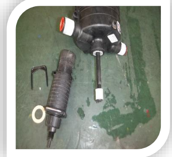
作動音はするが、液肥を吸い込まない。